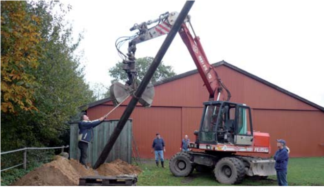
Langsam wird's. Alle gucken gespannt, einer positioniert mit einer gewöhnlichen Plattschaufel die Halteschleufe für den sicheren Sitz.