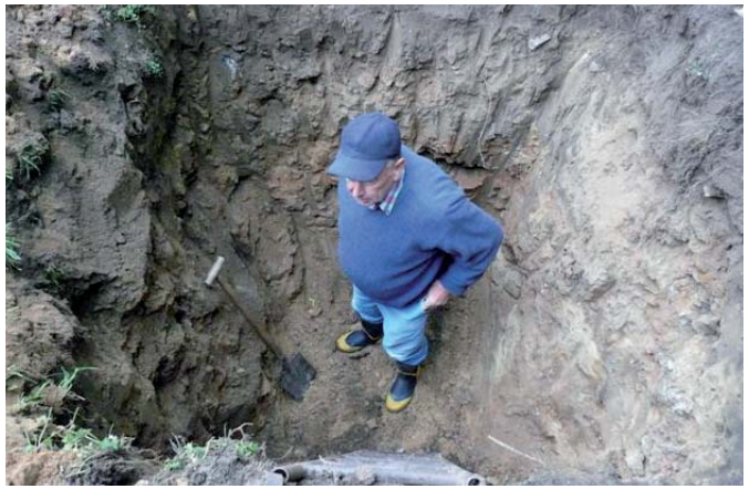
Wer hoch hinaus will, muss erst einmal tief hinein. Ein ordentliches Bauvorhaben will gut gegründet sein. Wollen wir mal hoffen, dass jeder mal buddeln musste. Jedenfalls hat sich das Fundament bis heute bewährt.