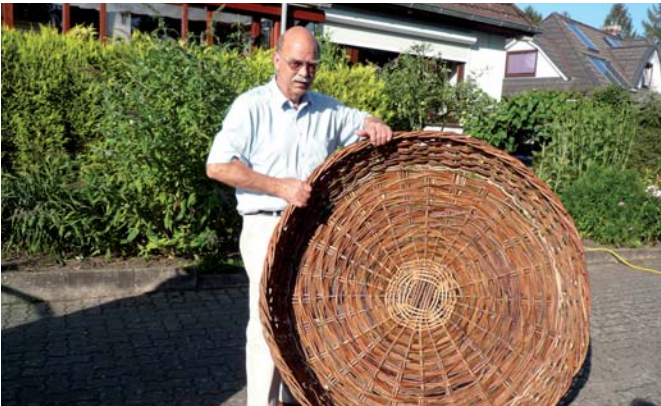
Hier präsentiert der Verfasser dieses Artikels - als i-Tüpfelchen - die Draufsicht des Storch-Ein-Zimmer-Appartements. Viel Platz ist ja nicht. Scheint aber dem gängigen Bedarf zu entsprechen. Und ist mietfrei.

diesem Frühjahr die Zustimmung der „Adebare“ gefunden hat.