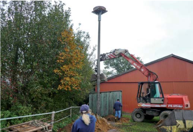
Fast geschafft. Noch gerade ausrichten und im Fundament befestigen, und schon ist das Nest fast fertig montiert. War doch gar nicht so schwer.